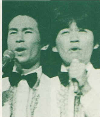
第2回グランプリ 狩 人