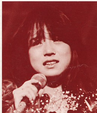
第7回グランプリ 中森 明菜